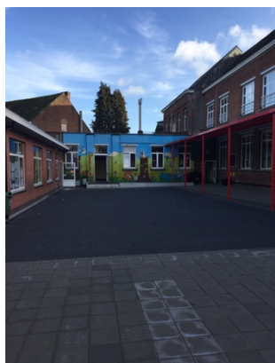
Speelplaats lagere school