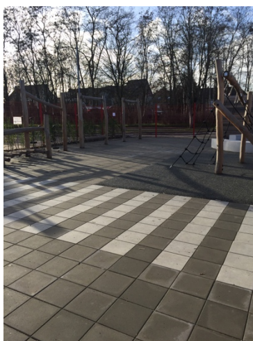
Speeltuigen lagere school