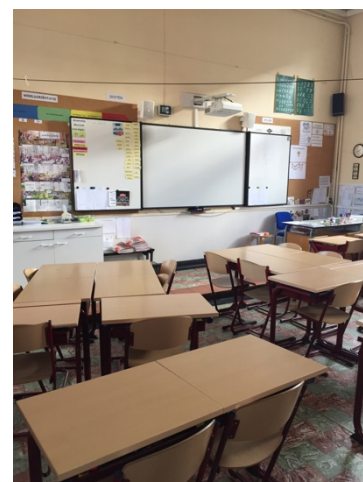
Klas 5de leerjaar