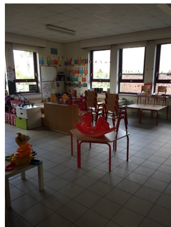
Klasje in de kleuterschool